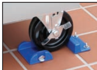
Kit de montage sur vis à serrage manuel

Pour faciliter l'installation, chaque système Safety-Set comprend à la fois du ruban adhésif en mousse compressible et un kit de montage sur vis à serrage manuel.